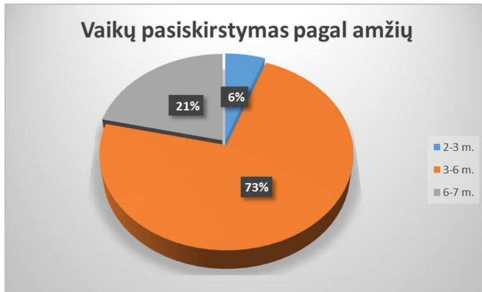
2 pav. Ugdytinių pasiskirstymas pagal amžių