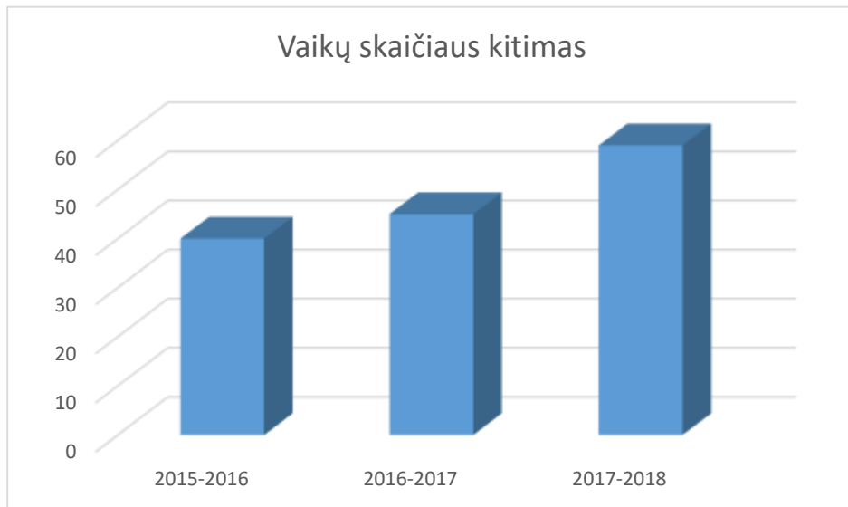
4. pav. Vaikų skaičiaus, kuriems reikalinga logopedo pagalba, augimo diagrama

Darželyje yra specialiųjų ugdymo (si) poreikių turinčių ugdytinių ir jų skaičius kiekvienais metais didėja, taip pat įstaigą lanko daug vaikų, turinčių kalbos ir komunikacijos sutrikimų, ir jiems reikalinga nuolatinė logopedo pagalba. Vaikams, turintiems specialiųjų ugdymo(si) poreikių, teikiama kompleksinė pagalba. Visų grandžių pedagogai (meninio ugdymo pedagogė, fizinio lavinimo specialistas ir kt.) bendradarbiauja, siekdami vientiso fizinės, emocinės ir pažinimo sričių plėtojimo, vadovaujantis visuminiu požiūriu į vaiką. Vykdomi projektai „Muzikos ritmu taisyklingos kalbos link“, „Smulkioji tautosaka vaikų veikloje“ ir kt., viktorina „Pasakyk žodelį“. Nuo 2017 metų darželio logopedas veda grupinius užsiėmimus vaikams, turintiems specialiųjų ugdymo(si) poreikių netradicinėse erdvėse. Žemiau pateiktame grafike matome, kaip kiekvienais metais daugėja vaikų, kuriems reikalinga logopedo pagalba.